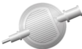
Schematische Abbildung eines 0,2 µ-inline-Filters